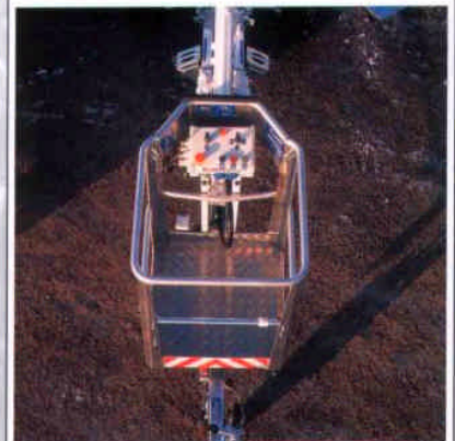
Im Aluminiumkorb der Bühne ist die zweite Bedienmöglichkeit (aller Bewegungen) mit zwei Geschwindigkeitsstufen.