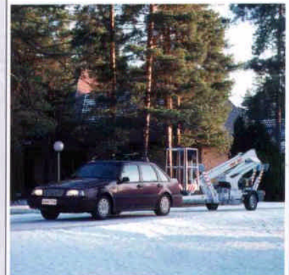
DINO 105T ist leicht und sicher zu ziehen.