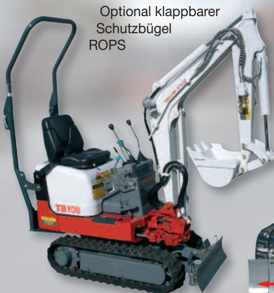
Optional klappbarer Schutzbügel ROPS